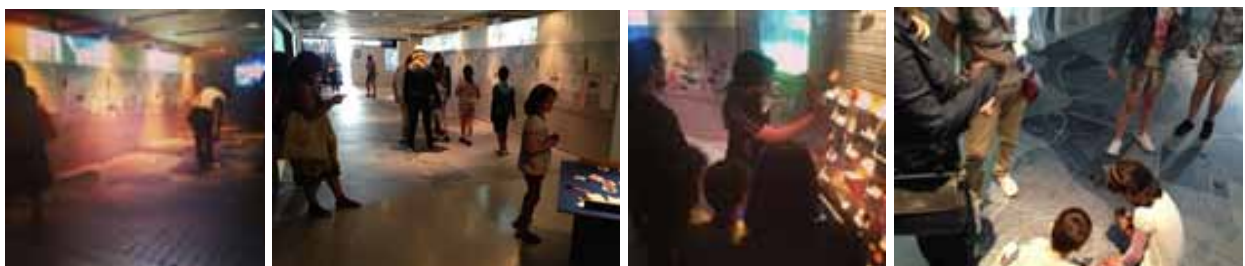
FIG. 04 - Atlas das Insurgências Multitudinárias composto por linha do tempo e mapa do município

O “Atlas das Insurgências Multitudinárias” foi uma das primeiras propostas museográficas que surgiu e se tornou a base para todos os outros projetos.