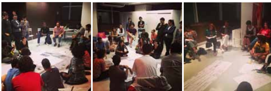
FIG. 01 - Reuniões assembleárias para decisões curatoriais e de produção do evento

uma crescente autonomia com relação tanto ao Estado quanto ao mercado. Neste sentido, como forma de experimentar novos processos curatoriais e de gestão de eventos, há uma tentativa de rever o papel das instituições dentro da atual crise da representação e envolve, no nosso caso, mais especificamente, a revisão do papel da Universidade e das instituições culturais, incluindo aí os processos, tanto de gestão de equipamentos e projetos, quanto os processos de produção de cultura e conhecimento. Para atingir estes objetivos e experimentar novos modos de organização, estamos adotando formatos de reuniões que utilizam um pouco da lógica assembleária 3 . Algumas diretrizes são conceituais e políticas, já apontando direções éticas que deverão permear todo o processo, desde a concepção até a realização.