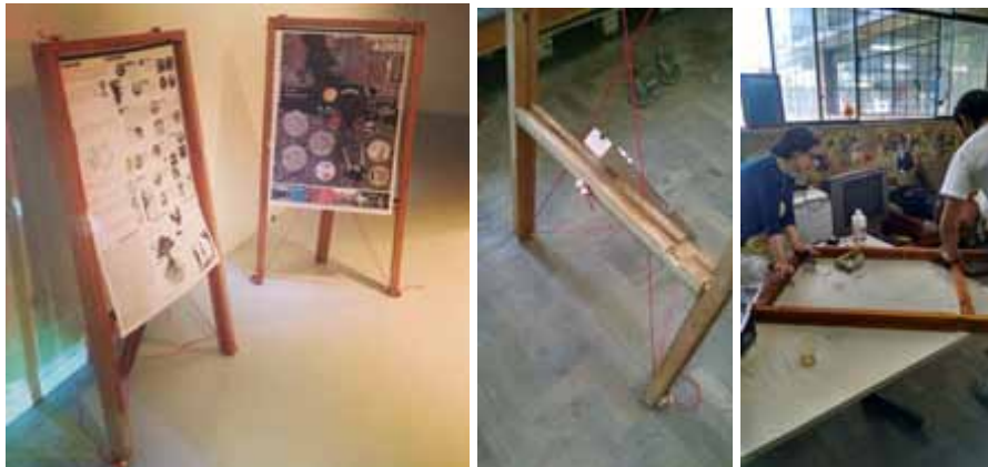
FIG. 02 - Display para Posters/Cartilhas Indisciplinares produzido no workshop Artesanias Expográficas

resíduos reaproveitados de exposições anteriores do Espaço do Conhecimento da UFMG. O mobiliário foi construído para ser utilizado na exposição “Cartografias do Comum” e também tem sido uma primeira ação do projeto de extensão “Artesanias do Comum” que pertence ao Programa “IND.LAB_Laboratório Nômade do Comum” do grupo de pesquisa Indisciplinar. O “Artesanias do Comum” possui ações que trabalham processos artesanais, acreditando na autogestão e, com ênfase nas artesanias, também pressupõe o uso de materiais recicláveis e reutilizados, assim como a produção coletiva e colaborativa. Produzir metodologias, táticas e estratégias para ampliar as possibilidades de uma vida em comum, o fazer-junto, fazer-com, e na construção de processos constituintes de uma nova sociedade baseada no comum é o principal objetivo deste projeto e daí a importância de envolver coletivamente diversos grupos que participam da exposição.